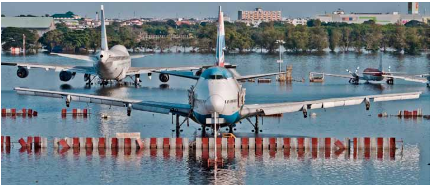
16. November 2011: Flugzeuge auf dem Don Muang International Airport in Bangkok während der Flutkatastrophe in Thailand.

Die Ergebnisse des AGCS Risk Barometer verdeutlichen auch die systemische Verknüpfung von Risiken. Besonders deutlich wurde diese im Jahr 2011, als eine außergewöhnliche Häufung schwerer Naturkatastrophen in einem extrem schwierigen Wirtschaftsumfeld weltweit zu